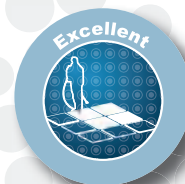
Abb.: E 130.2-9 X-tra